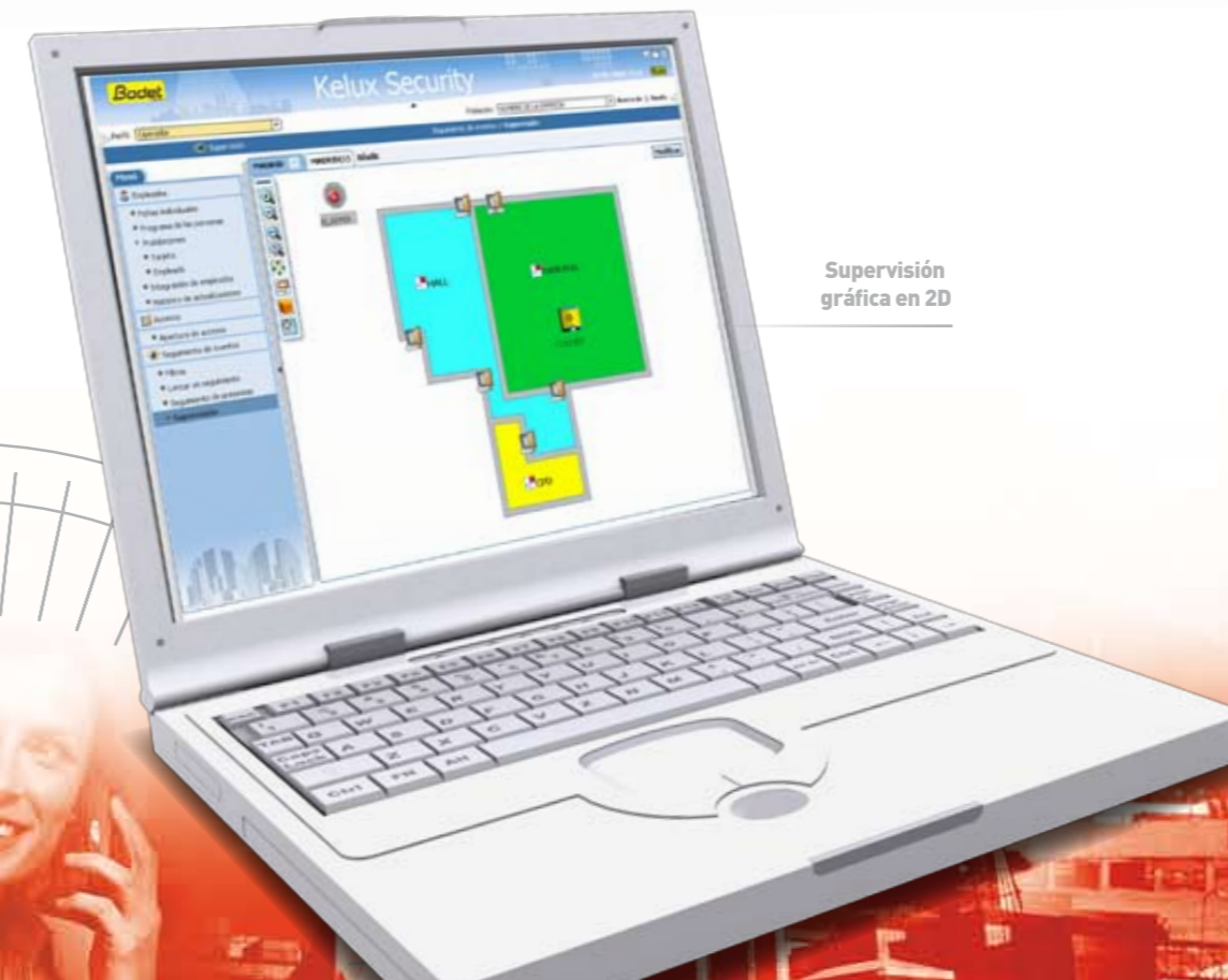
Supervisión gráfica en 2D

Multi-tecnologías de tarjetas y lectores en una misma instalación. Integración nativa con los sistemas de gestión de tiempo Kelux Prima, Integral y Optima.