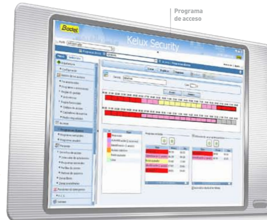
Programa de acceso