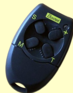
Mando a distancia inalámbrico